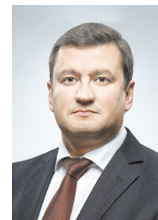
Евгений Арапов, глава города Оренбурга